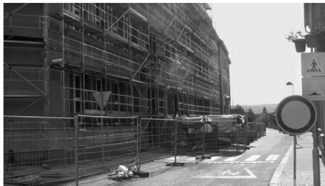
Část školy už je bez lešení, s hotovým zateplením a fasádou. Jinde se stále pilně pracuje.