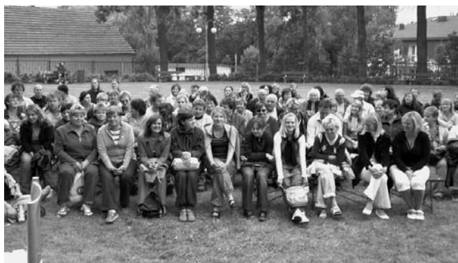
S jejich vystoupením o zákoutích ženské duše za kostelem byli bousovští diváci velice spokojeni.