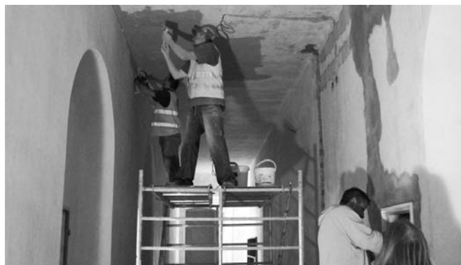
Práce ve školní budově koncem srpna mohutně finišovaly. Vždyť 9. září má začít školní rok!