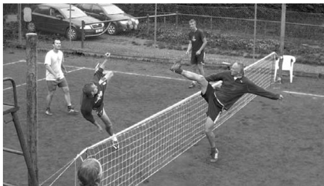
Nohejbalový turnaj se kvůli dešti musel hrát ve dvou termínech. Nabídl zajímavé momenty.