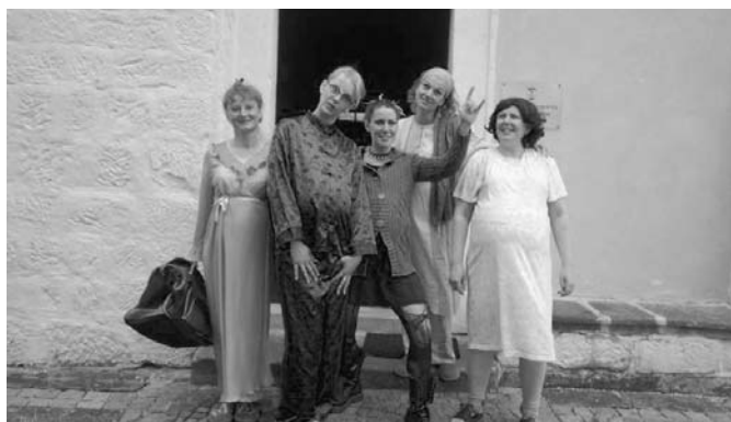
Turnovský soubor Nakafráno byl před divadelním představením Božský řízek v dobré náladě.