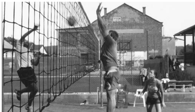
Na 17. ročník turnaje ve volejbalu dorazilo celkem osm družstev. Vyhrál Jablonec nad Nisou.