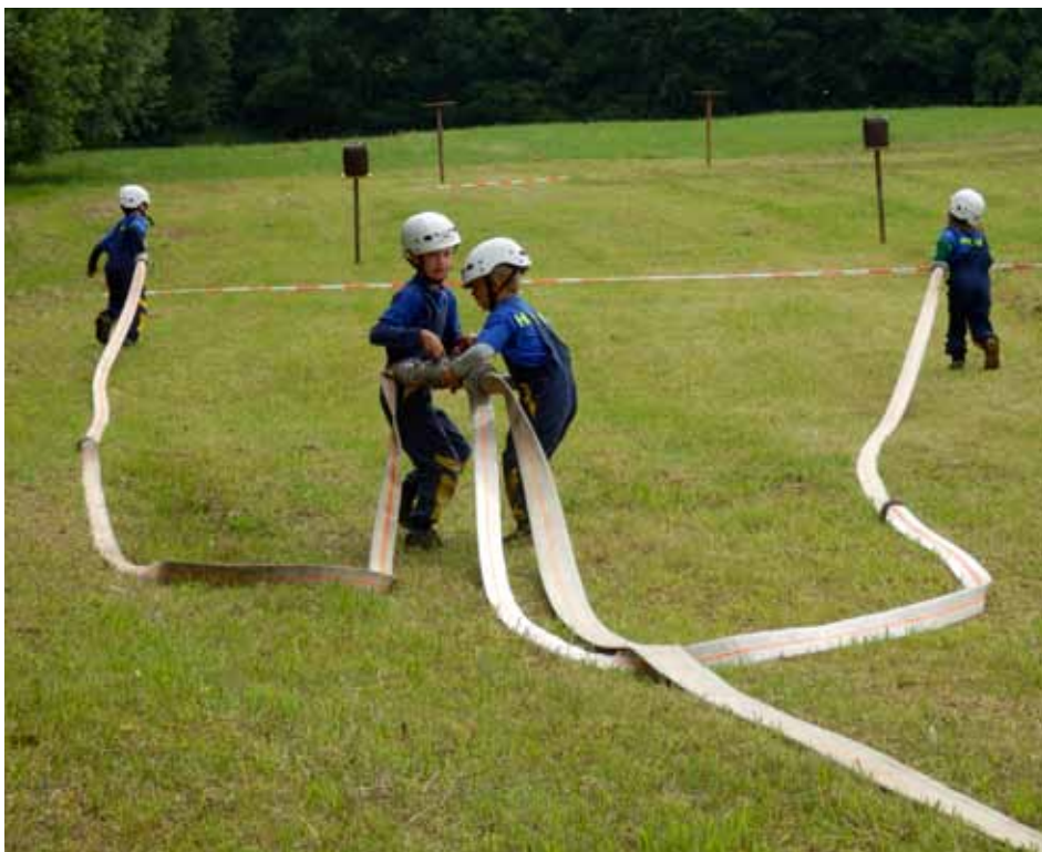
Příprava SDH Bechov požární útok - Vlčopolská Kapka

Do prázdnin jsme pak stihli ještě dvě soutěže. Nejprve děti na poháru Škoda Auto získaly třetí místo a týden poté na Vlčopolské kapce místo druhé a třetí. Kapky se po delší soutěžní odmlce zúčastnila i příprava a dvěma prvními místy z útoku a štafety dala jasně najevo, že doma zůstat nechce.