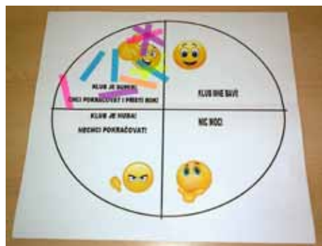
Děti hodnotí čtenářský klub velmi pozitivně

V minulém čísle Bousováku jste si mohly přečíst dopis klubové čtenářky Terezy Dlaskové. Dopis byl reflexí našeho výletu