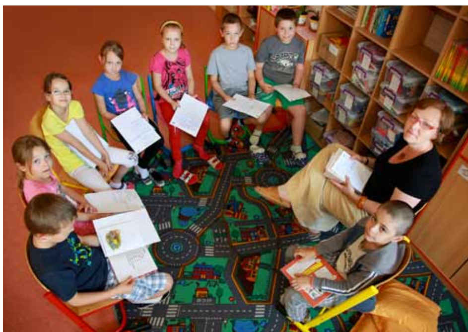
Povídání o přečtených knihách