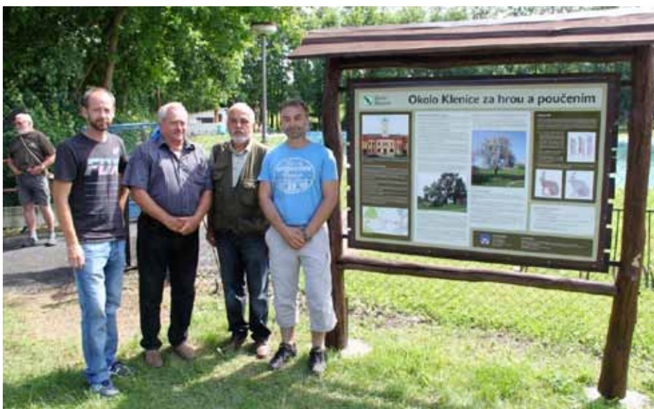
Slavnostní otevření naučné stezky za účasti autorů a starosty města

Letošní hnízdění dopadlo dobře, končí poklidný slavičí rok. Během prázdnin všichni odletí.