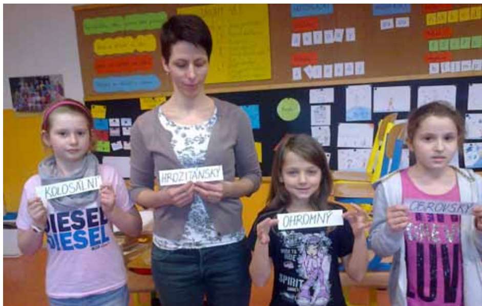
Aktivita se slovy – řadíme pojmy podle síly

Letos jsme se scházeli ve dvou skupinkách – v pondělí od 13 do 14 hodin druháci a po nich od 14 do 15:15 třetíci. Každá klubová lekce je jiná, přesto mají společné prvky, rituály. Zahajujeme vždy písničkou s pohybem, potom následuje posezení v kruhu, kde každý představuje svou momentálně rozečtenou knihu (tety Olgu a Janu nevyjímaje). Pak přichází čas