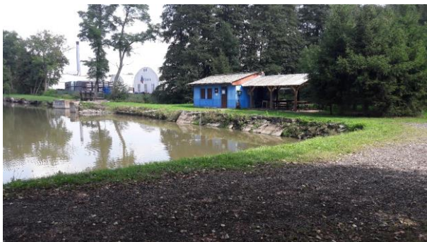
Foto rybník Továrenský

Další spolky, které se věnují mládeži, jsou Sbory dobrovolných hasičů Dolní Bousov, Bechov – Svobodín a Horní Bousov . Sbory dobrovolných hasičů vedou dětské oddíly požárnímu sportu, ve kterých se děti učí samostatnosti a trénují tělesnou zdatnost. SDH se pravidelně zúčastňují pravidelných soutěží v požárním sportu. Sbory sami pořádají soutěže ve svých místních částech. Zapojují se do organizace akcí pořádaných ve městě a příslušných místních částech.