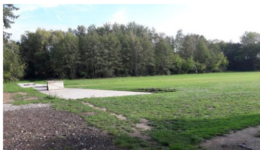
Foto: hasičský areál Svobodín