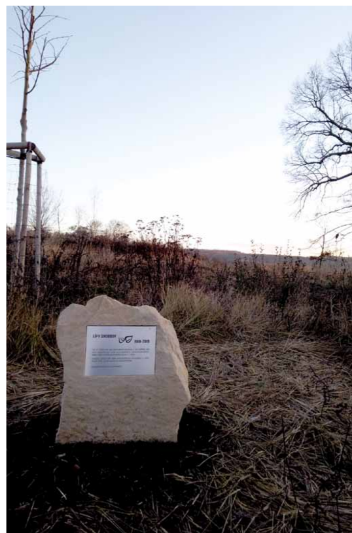
Na Rachvalách lípy označuje pamětní deska