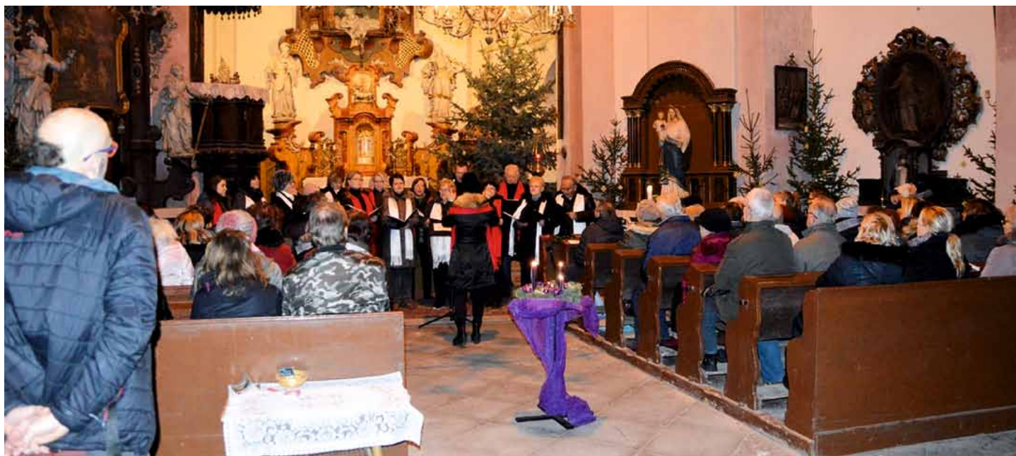
Adventní koncerty v podání místního sboru Stojmír-Bendl mají vždy krásnou, sváteční atmosféru.