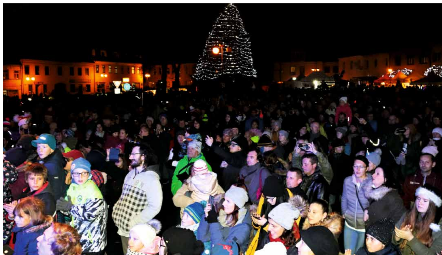
22. Mikulášská nadílka na náměstí T.G.M. měla opět hojnou návštěvnost.