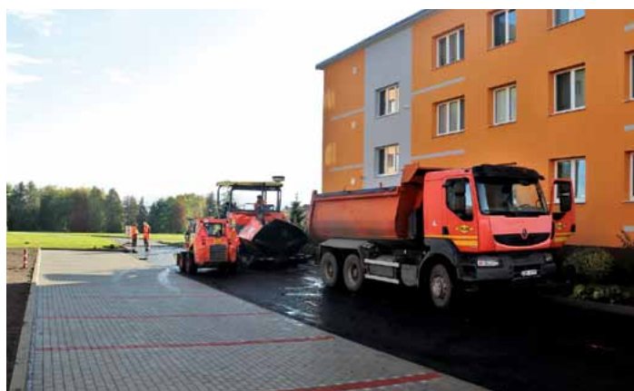
V prostoru Na Sídlišti vzniklo mnoho parkovacích míst