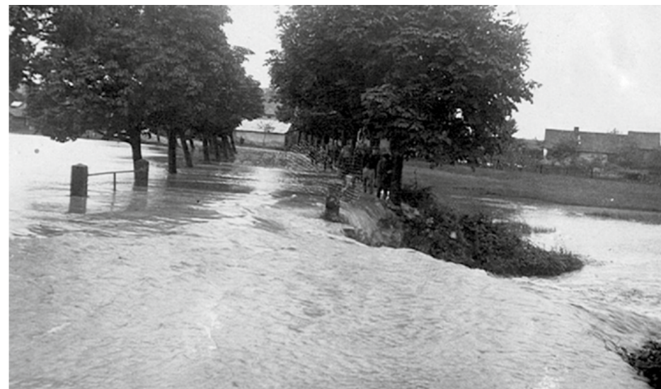
Bousovský potok se přelil v ul. Na Hrázi (1926)

Výlov rybníka je pro všechny velkou událostí. Na výlov Červenáku se každoročně chodí dívat děti z místní školky a školy. Rybáři vždy rádi dětem vysvětlí, jak výlov probíhá, ukážou jim vybrané ryby a zodpoví zvědavé otázky.