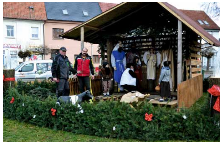
Betlém na náměstí autoři doplnili o figury dětí a ovcí