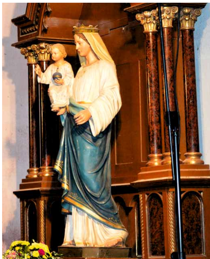
Svatá Anna na bočním oltáři v kostele sv. Kateřiny