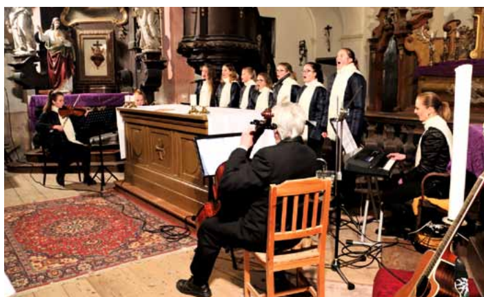
Adventní koncert v podání dětského sboru Řetízek