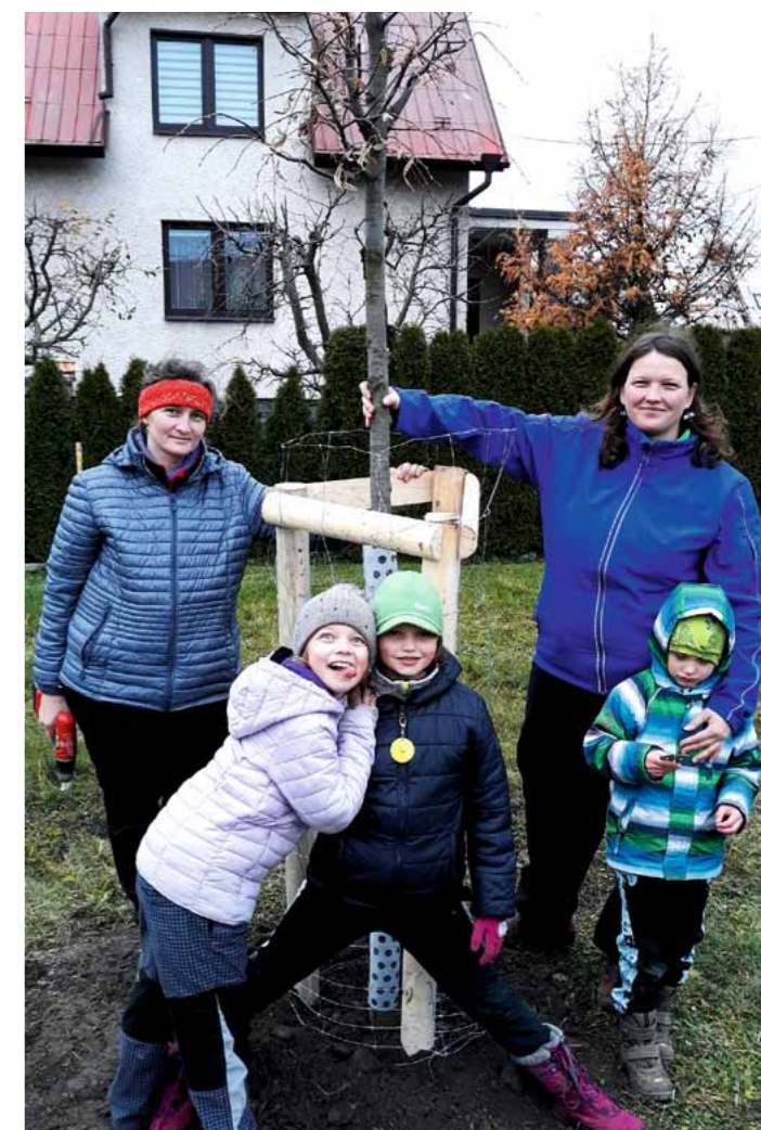
Nová lípa v ul. Požárníků vysazena dobrovolníky