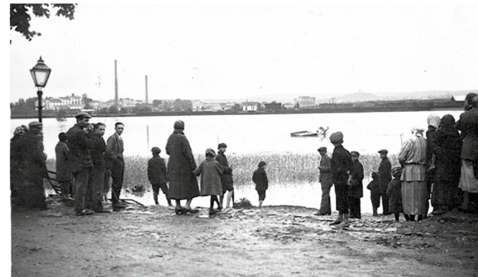
Povodeň roku 1926 - vylitá Klenice v prostoru dnešního fotbalového hřiště

Pojďme si přiblížit nelehkou práci rybářů, kteří pracují na podzim ponoření ve chladné vodě. V dávných dobách se rybářský personál skládal z „fišmajstra“, mládka a několika „fišknechtů“. Následovala ještě celá řada robotného lidu, vedená rychtáři. Dnes mají rybáři trochu usnadněnou práci díky nepromokavému oblečení, vysokým gumákům a částečně