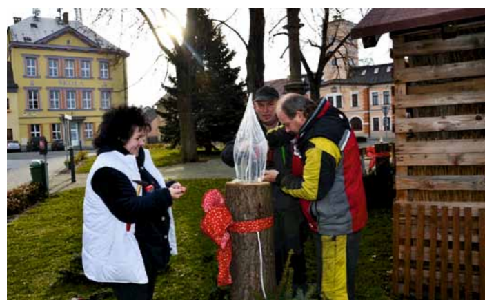
Adventní věnec na náměstí měl své 4 svíčky