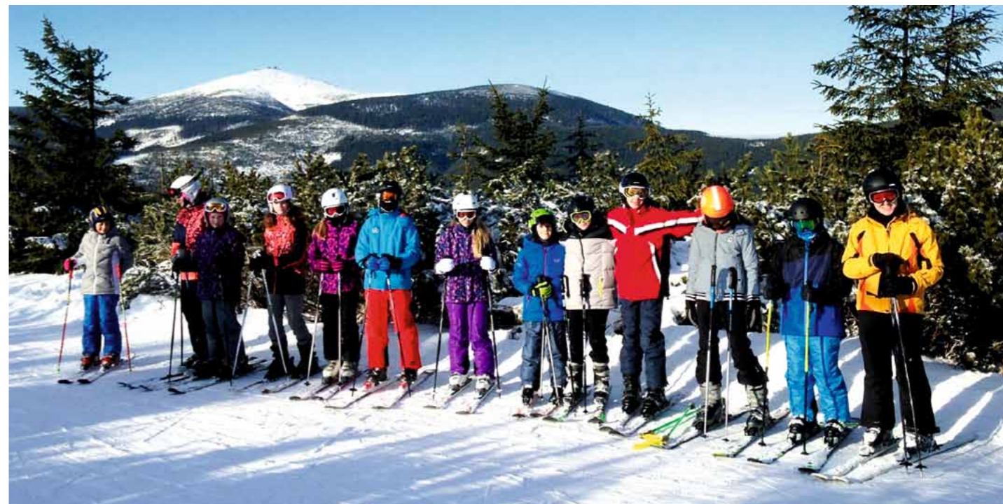
Letošní lyžařský kurz pro žáky 7. tříd proběhl v Horní Malé Úpě

Tel.: 721 236 158, info@vantop.cz , www.vantop.cz