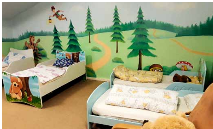
Dětský domov v Ml. Boleslavi - cíl tradiční vánoční sbírky ZŠ