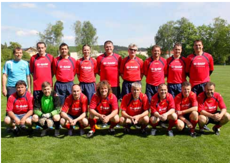
Vítězná sestava staré gardy Dolní Bousov.

SG DBSK - SG Dlouhá Lhota 2:1, branky: Havel, Karn z PK; SG DBSK - SG Dětenice 1:1, branky: Karn; SG DBSK - SG Libáň 1:0, branky: Šouta; SG Dlou-