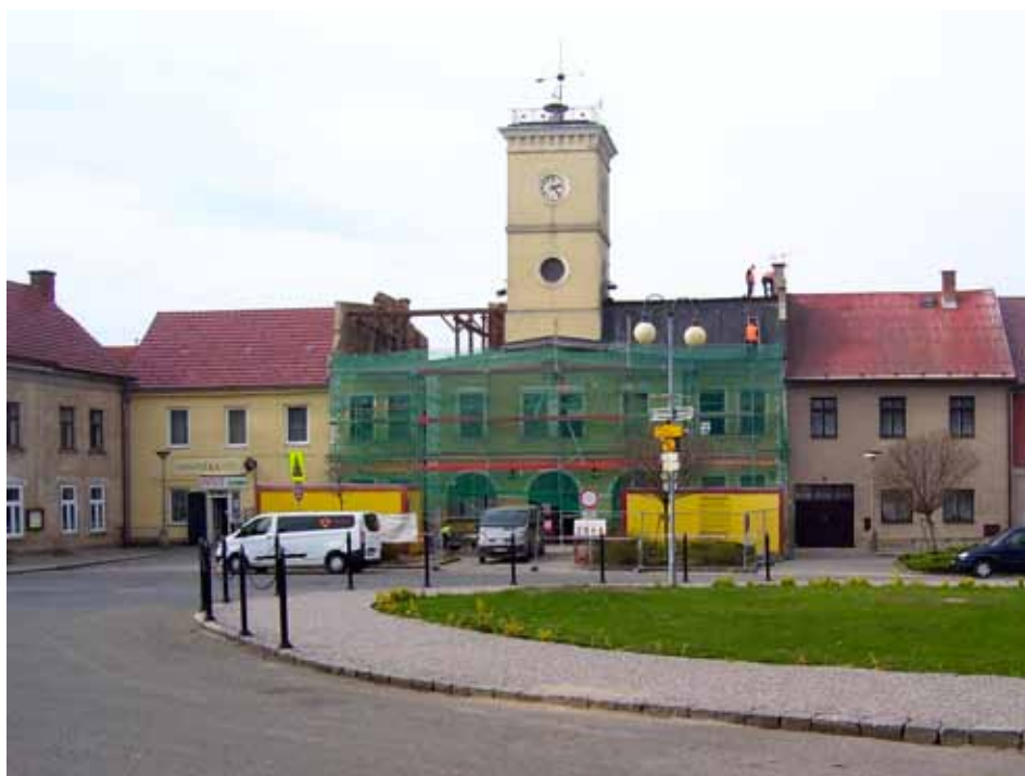
Během rekonstrukce bylo potřeba sundat střechu radnice a zcela vyměnit krovy.