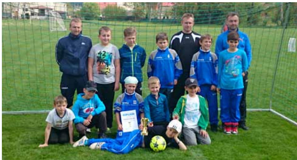
Starší minizáci DBSK na turnaji.